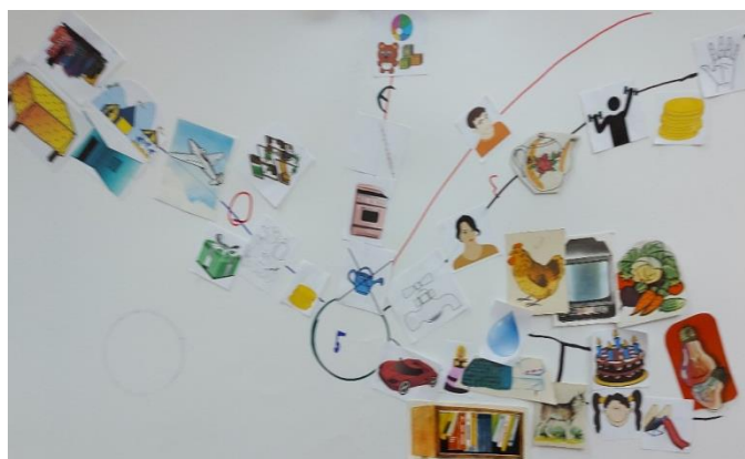
Ментальная карта «Семейный бюджет»